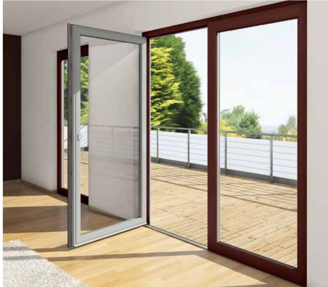
Kreative Möglichkeiten bei der außen- und innenseitigen Gestaltung mit Schüco AutomotiveFinish.