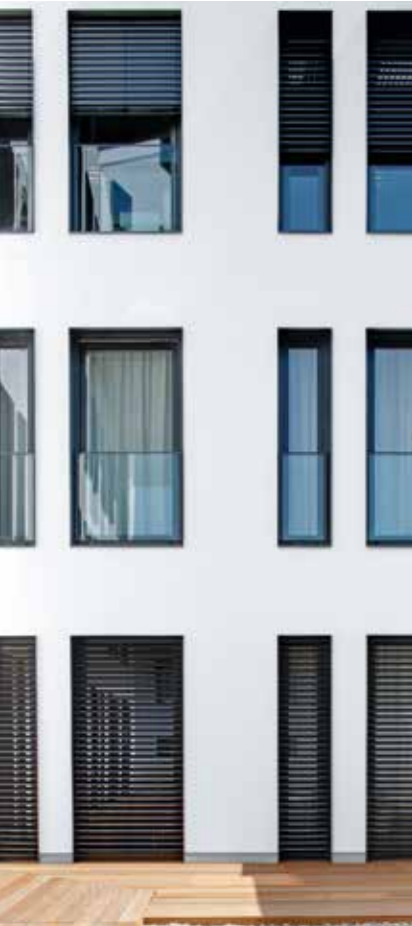
Mit Schüco AutomotiveFinish lassen sich neue gestalterische Impulse mit preislich attraktiver Leistung verbinden.