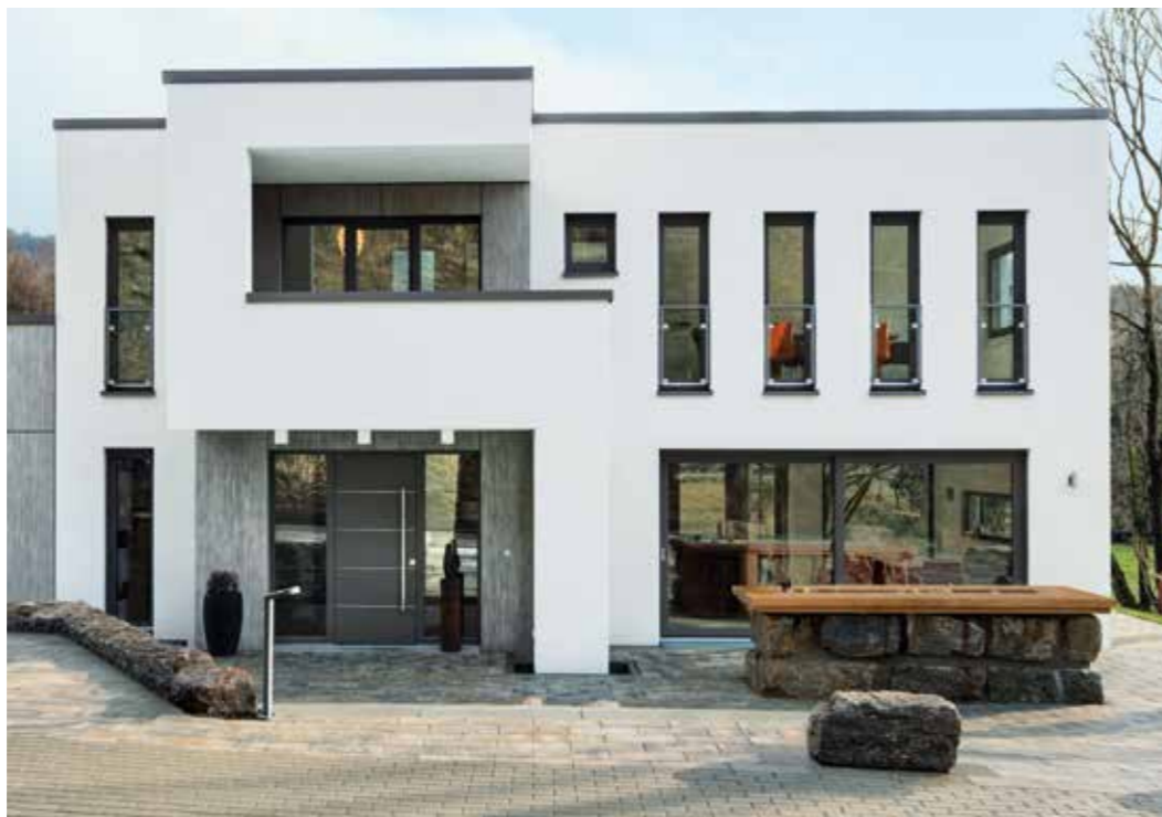
Schüco LivIng bildet die perfekte Grundlage für moderne, zeitgemäße Haustüren.

Eine Haustür ist die Visitenkarte eines Hauses und verleiht dem Eingangsbereich Charme und Ästhetik. Aber nicht nur optisch muss eine Haustür überzeugen. Funktionalität und Langlebigkeit stehen dabei ebenso im Mittelpunkt. Mit Schüco LivIng können Sie Ihre persönlichen Ansprüche in einer Tür vereinen. Gestalten Sie Ihre neue Kunststoff-Haustür ganz nach Ihren Vorstellungen und Wünschen. Gleichzeitig bietet Schüco LivIng eine innovative Technologie, die beste Wärmedämmung bis auf Passivhausniveau und erhöhten Einbruchschutz bis zur Widerstandsklasse 2 (RC2) ermöglicht.